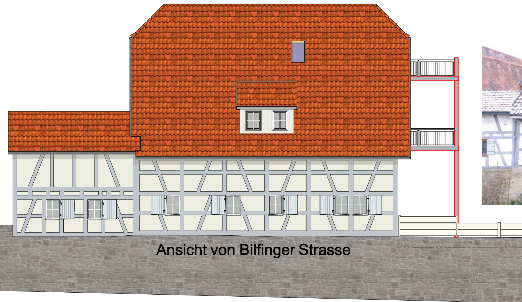
Ansicht von Bilfinger Strasse