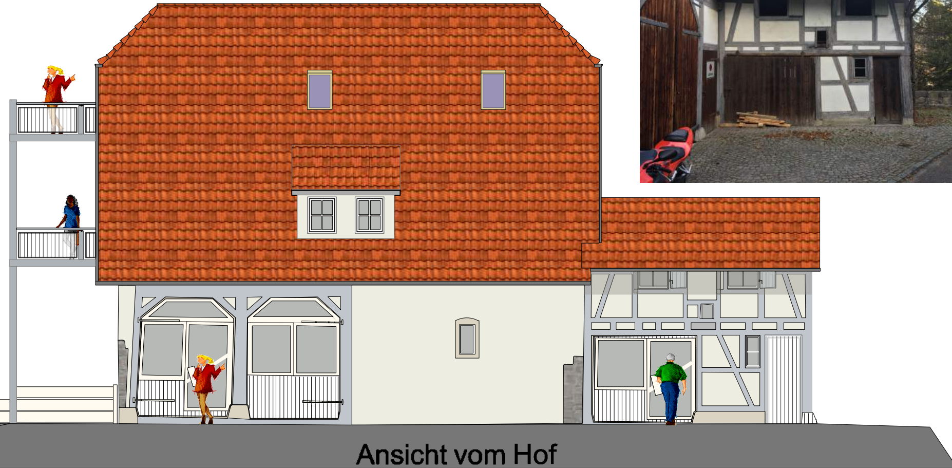
Ansicht vom Hof